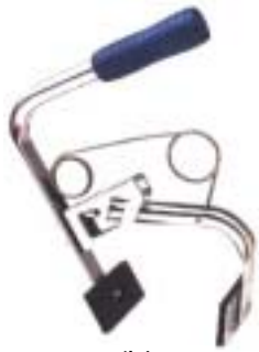
スチール製 ゴムパッド