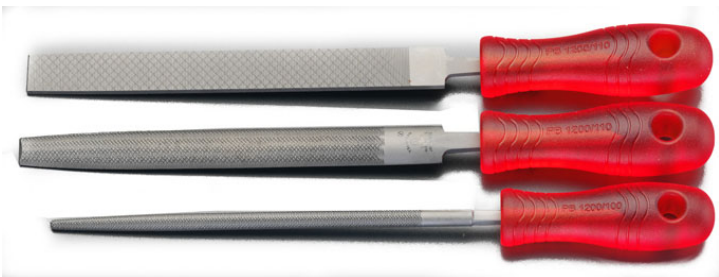
平・半丸・丸3本セット