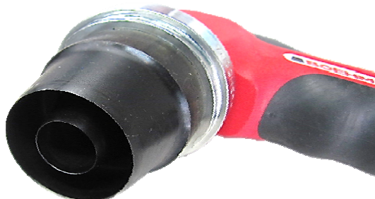
図2 ポンチの取付け例