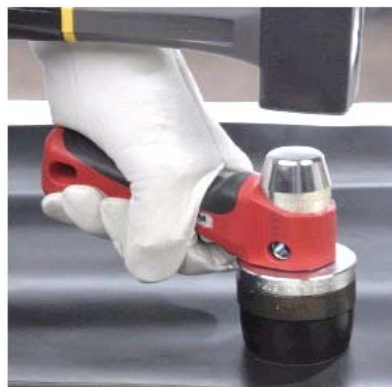
図3 パッキンの作製例