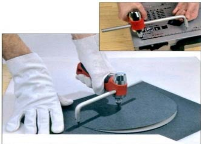
図 4 コンパスカッター使用例