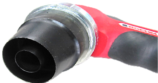
図 2 ポンチの取付け例