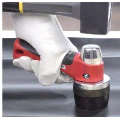
図 3 パッキンの作製例