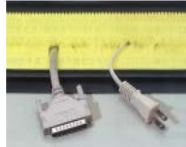
OAデスクなどの目隠し及び ゴミやホコリの侵入防止