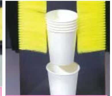
カップを一つずつ取り出す為のガイド