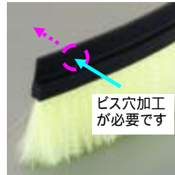
ビス穴加工 が必要です

注) ・取り付けには、お客様でビス穴加工や接着が必要です。 ・シャッターの隙間対策には使用しないで下さい。 ・黄色は紫外線に弱く劣化しますので屋外には 取り付けしないで下さい。