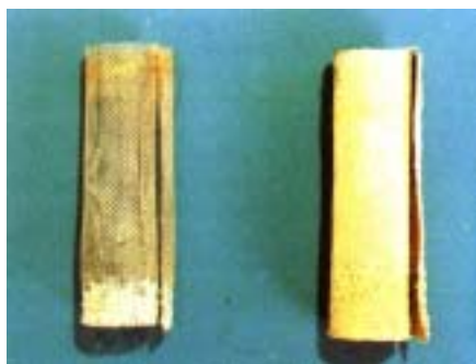
左 : テイクワン使用トイレ設置試験片 右 : テイクワン未使用トイレ設置試験片