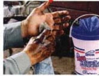
サッと拭くだけで