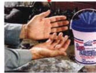
こんなにきれいに!