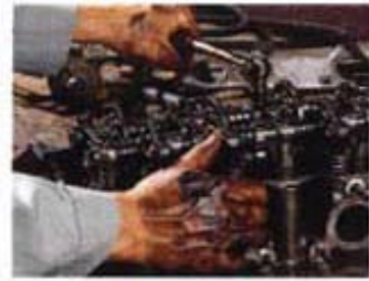
こんな頑固な汚れも

スクラブは、ザラザラ面 (軽石効果) と滑らか面 (仕上げ拭き) のダブルサーフェス加工ですので 汚れを擦り落すことも仕上げ拭きも1枚ですみます。