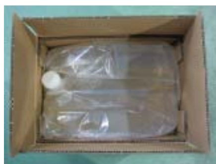
BIB(バックインボックス)タイプ