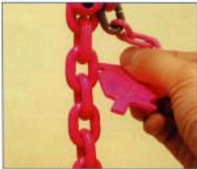
チェーンの線径を測定します。