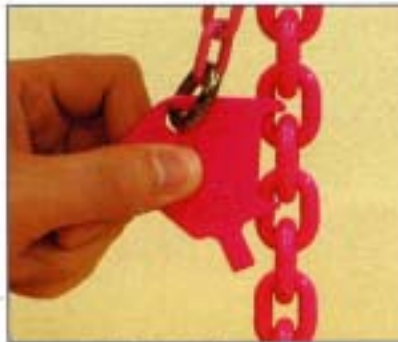
リンクの外伸びを測定します。