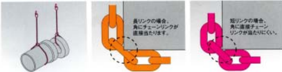
■チェーン内長比較

チェーンは下記のような荷を直接巻いて吊り上げることがよくあります。角に当たるチェーンソックに対する影響を最小限に抑えるために、短いリンク寸法で設計しております。下記に他社のチェーンとの比較を行っております。