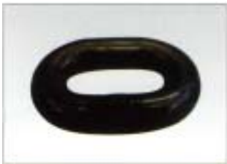
溶接を終えたばかりのリング。