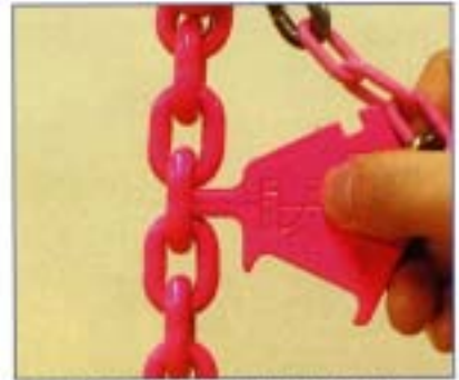
リンク間の磨耗や伸びを測定します。